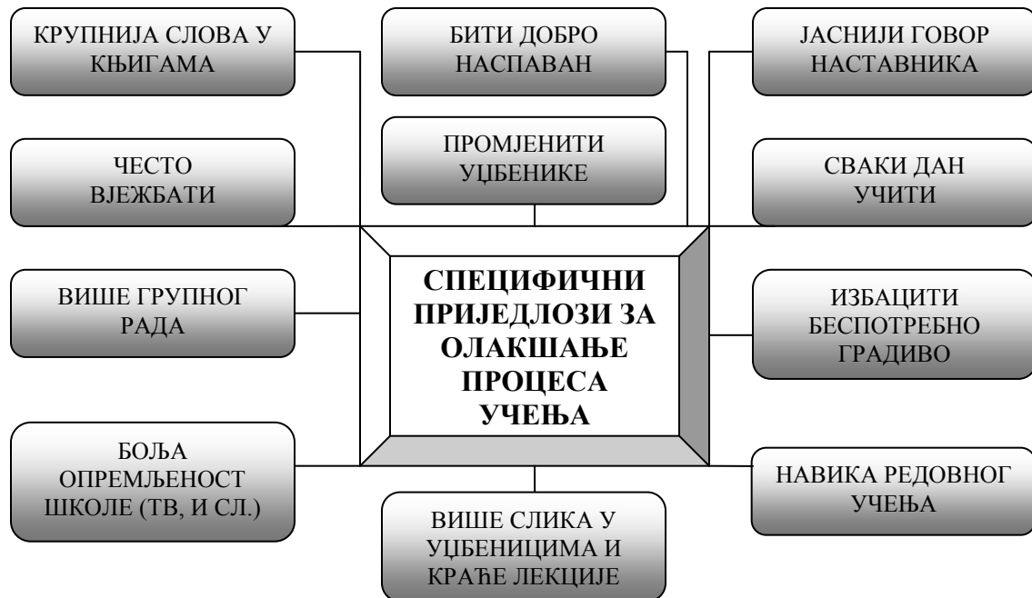
Слика 1.: Специфични приједлози ученика за олакшање процеса учења

Ова три најупечатљивија приједлога нису ништа друго него антитеза свим досада евидентираним тешкоћама учења са којима се ученици предметне наставе сусрећу. Поједини ученици наводе и специфичне приједлоге за олакшање и већу продуктивност процеса учења. Између осталог, они говоре о (Види слику 1!):