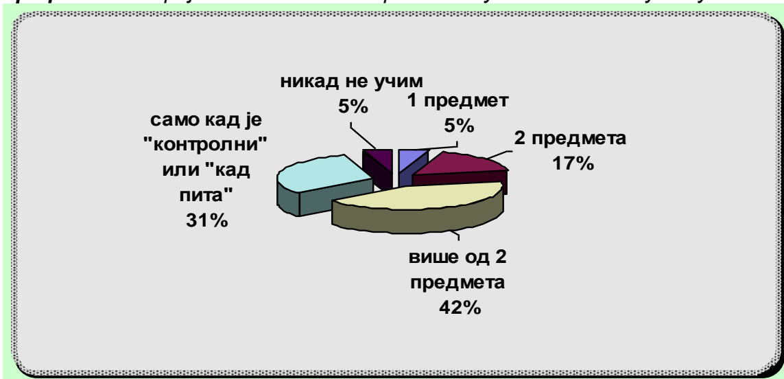
Графикон 2.: Бројност наставних предмета у ваншколском учењу

Наредни графикон представља однос дневне заступљености броја наставних предмета у ваншколском учењу: